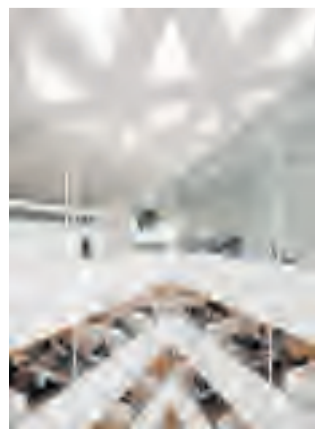
Krystallen er på 6.850 kvadratmeter og er opført i perioden 2008-10.