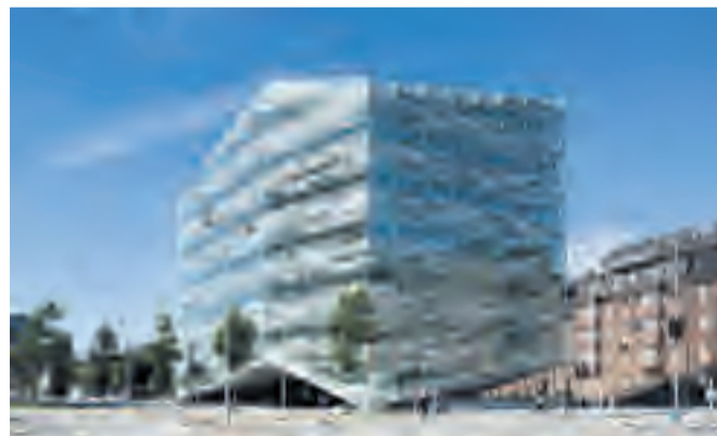
Krystallen er en del af Nykredits hovedsæde i København.