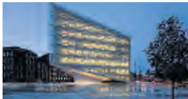
Århusianske schmidt hammer lassen architects har vundet en pris for deres bygning Krystallen i København. Prisen er en såkaldt Emirates Glass LEAF Awards 2011.

Vinderne af prisen bliver annonceret i Barcelona 2.-4. november 2011.